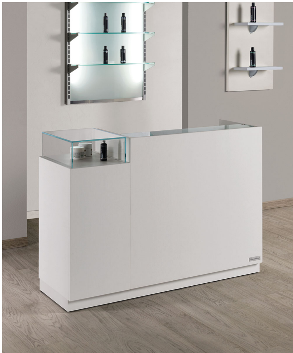
OBERFLÄCHEN IM FOTO: WHITE ASH 06

Le immagini sono fornite al solo scopo illustrativo e non costituiscono elemento contrattuale