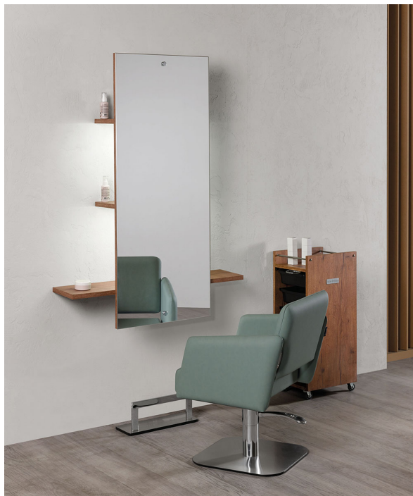
OBERFLÄCHEN IM FOTO: VINTAGE 01

Le immagini sono fornite al solo scopo illustrativo e non costituiscono elemento contrattuale